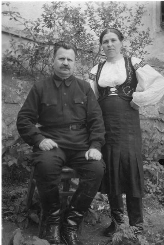
Мама з батьком. Кінець 40-х років.