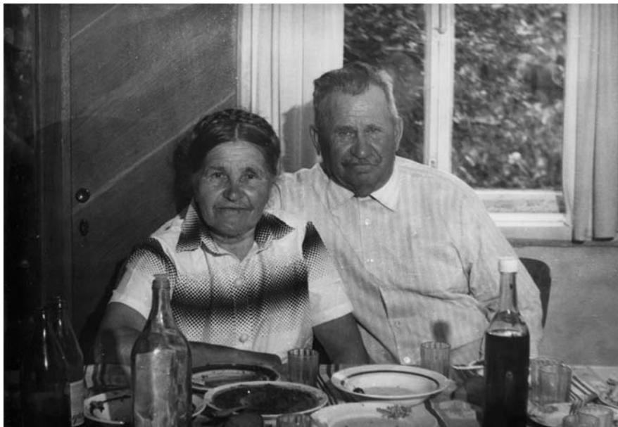
Батько з мамою. 80-і роки.