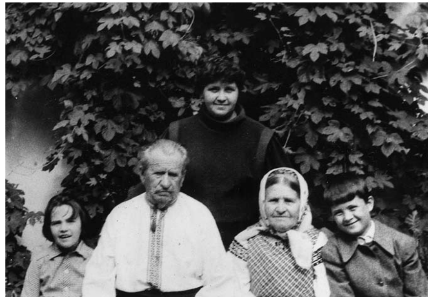
Під хатою в Березані.