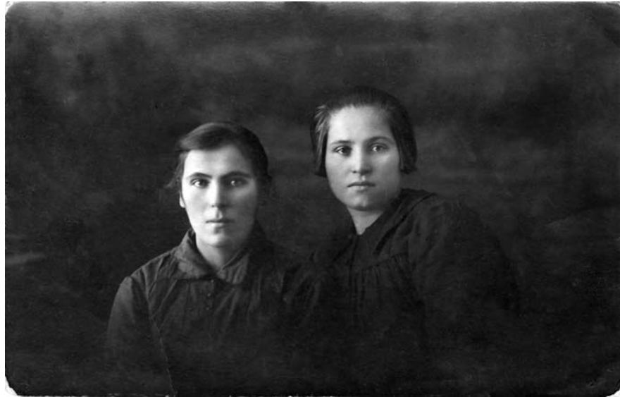
Мама із сусідкою. Середина 30-х років.

життя. Хлопці, що напали на поїзд, викрикували: «Цариця поїхала в Тулиголови». Причина цієї ганебної справи полягала в тому, що хлопцям на весіллі не дали могорича, якого вони домагалися. Вони вимагали 1/4 частину відра горілки, кусок сала й паляницю, але їм відмовили, от через те й трапилась така хуліганська витівка з боку хлопців. В Тулиголовах, цебто в нашій хаті, весілля гуляли цілий тиждень.