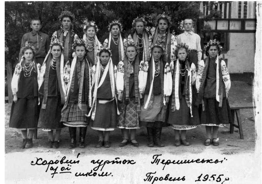
Хор сільської школи.

Санжара слухав уважно зауваження голови атестаційної комісії, але не промовив жодного слова. Ще деякий час Санжара поводив