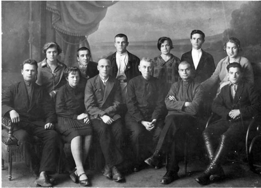
Слухачі педагогічних курсів